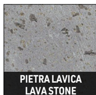
PIETRA LAVICA LAVASTONE