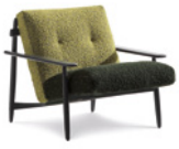
04 TRIO POLTRONE CM 80X90 H75 - MIX "B"