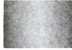
10 WISP SHADE TAPPETO CM 600X450 - SPECIAL SIZE