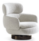
06 VIVIANNE BERGÈRE GIREVOLE CM 90X92 H77