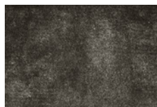
11 DIBBETS TAPPETI CM 500X300