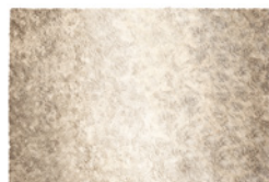
09 WISP SHADE TAPPETO CM 600X500