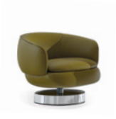
05 VIVIENNE POLTRONE LOUNGE GIREVOLI CM 74X77 H66