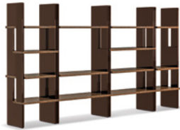
10 ZOE LIBRERIE CM 100X46 H103