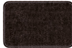
11 OUTLINE ROUNDY TAPPETO CM 600X500