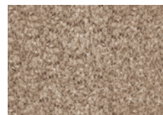
10 WISP TAPPETO CM 600X500