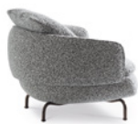
04 VIVIENNE POLTRONE LARGE GIREVOLI CM 102X91 H78