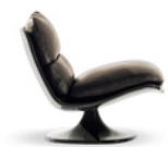
05 PATTIE POLTRONE CM 78X91 H76