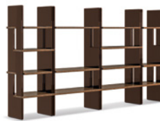
11 ZOE LIBRERIE CM 100X46 H208 - MOD. A