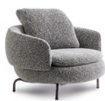
04 VIVIENNE POLTRONA LARGE FISSA CM 102X91 H78