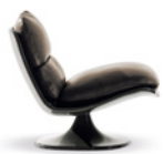
03 PATTIE POLTRONA CM 78X91 H76