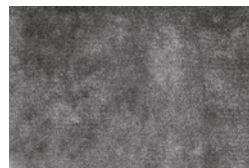
09 DIBBETS TAPPETO CM 500X400