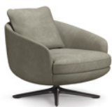
03 RAPHAEL POLTRONE GIREVOLI CM 74X86 H78