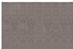
07 OSAKA CHEVRON TAPPETO CM 500X300