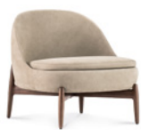
02 SENDAI POLTRONE CM 74X76 H72