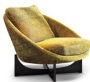
04 LIDO POLTRONA CON BASE CM 93X99 H85