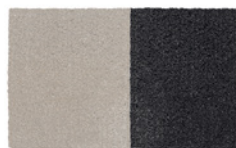
08 DIBBETS FLAG TAPPETO CM 500X300