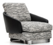
6 LAWSON LARGE FAUTEUIL CM 84X98 H80