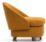
7 LAWSON LOUNGE SESSEL CM 72X78 H74