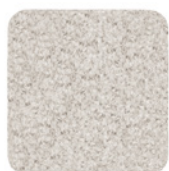
15 WISP ROUNDY TEPPICH CM 600X600