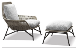
5-6 PRINCE "CORD" INDOOR SESSEL CM 83X88 H85 HOCKER CM 70X51 H43